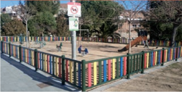
● Instalación de una valla de colores en el parque infantil Manel Boga