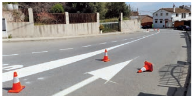
● Repintado de la señalización horizontal y mejora de la seguridad en Sant Roc