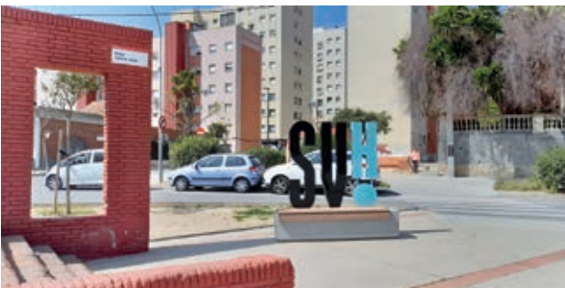
● Instalación, en varios puntos del municipio, de nuevos bancos con la imagen de la marca de la ciudad