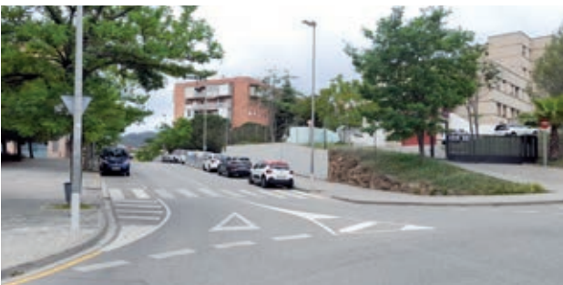
● Mejora de la seguridad vial en la calle Rafael Casanova