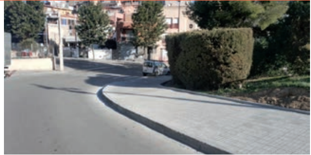
● Ampliación de la acera en la calle del Cementiri, confluencia con la avenida Mil-lenari