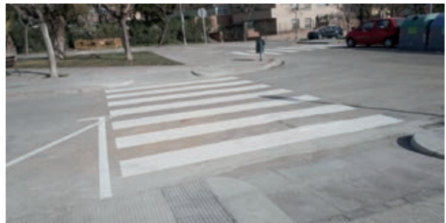
● Construcción de un paso de peatones adaptado en la calle Corunya