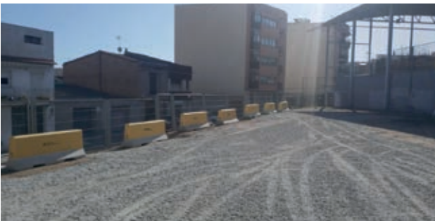
● Recuperación de la zona de aparcamiento situada junto a la pista Francesc Macià