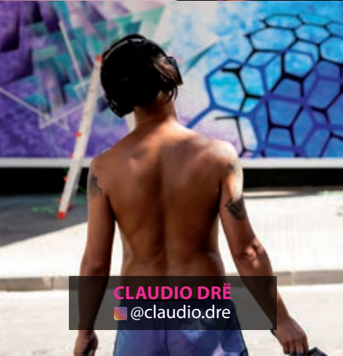
CLAUDIO DRĚ @claudio.dre