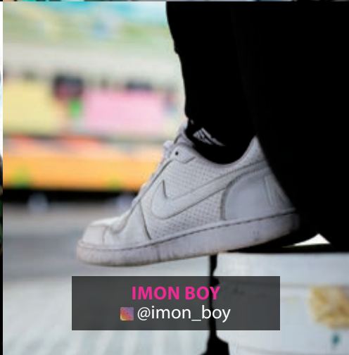
IMON BOY @imon_boy