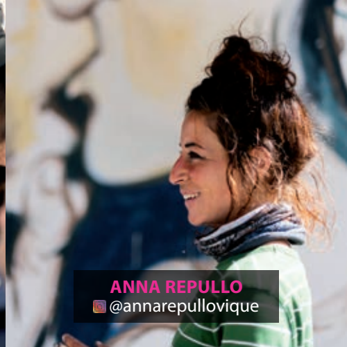
ANNA REPULLO @annarepulloviue